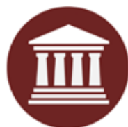
Forum voor Democratie